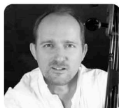
エマニュエル・ ジラル (チェロ)