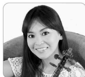
神谷未穂 (ヴァイオリン)