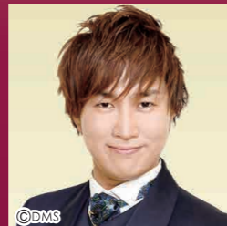
海道弘昭 テノール