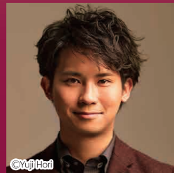
三浦文彰 ヴァイオリン